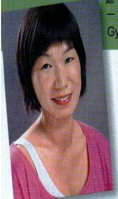
Ruby Senior Reporter

另外，還有 Pilates Reformer 健體法，Pilates 是需要1套創新的儀器 Reformer、Trapeze Table、Wunda Chair 和各種各樣的 barrels 組成，利用這系列儀器，可以進行超過500種不同的運動，同樣是鍛煉及協調深層肌膚，因為儀器有一定重量，而且需要慢動作進行，所以比起 Gyrotonic，更需要肌肉力量。